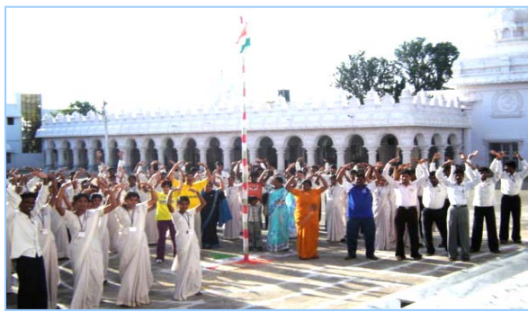
■ 在印度班加罗尔炼功 (2009.5)

当人们加入中共组织时都发过毒誓——把生命献给其组织，那么就会在天灭中共时成为其牺牲品，只有声明退出中共的组织才能废除毒誓，才能在大劫难中保住性命，世界各国有很多古老而著名的预言都提到了当今正在发生的事；2002年6月贵州平塘县掌布乡发现了2亿7千万年前的藏字石，巨石断