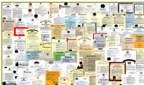
■法轮大法获各国政府褒奖、支持议案信函超过3000项。

◎ 各国、各地政府和团体组织纷纷颁发褒奖、通过支持议案，及宣布“法轮大法月”、“法轮大法周”和“法轮大法日”，以各种形式支持法轮大法。