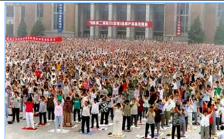
■ 沈阳万名法轮功学员集体炼功 (1998年)。

在古老的佛国印度，大城市都有炼功点，仅班加罗尔就有八十多所学校师生修炼法轮功，学生在体育课集体炼功，法轮大法主要著作《转法轮》中的《论语》被纳入学校英文教材的卷首。