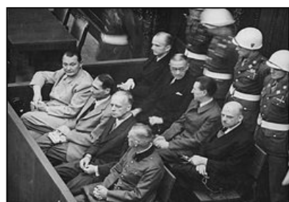
图：纽伦堡审判历史图片

在 60 多年前对德国纳粹罪行进行审判的纽伦堡审判，是人类有史以来最大规模的审判。审判一开