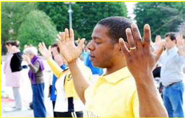
■“真善忍”巨大威德和感召力超越国界，受到各族裔的珍视。图为今年五月法国法轮功学员在庆祝活动中集体炼功。