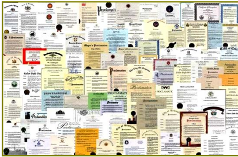
■法轮大法获各国政府褒奖、支持议案信函超过 3000 项。

◎ 法轮大法已洪传世界一百一十四个国家和地区（其中亚洲：三十二个；美洲：二十一个；欧洲：四十个；大洋洲：三个；非洲：十二个）。