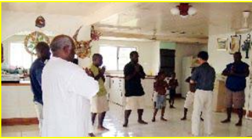
■南太平洋岛国—巴布亚新几内亚前副总理及家人学炼法轮功。