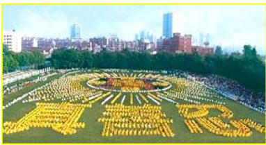
■一九九八年，武汉，五千多名法轮功学员集体炼功。

◎ 各国、各地政府和团体组织纷纷颁发褒奖、通过支持议案，及宣布“法轮大法月”、“法轮大法