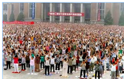
■ 沈阳万名法轮功学员集体炼功 (1998 年)。

在古老的佛国印度，大城市都有炼功点，仅班加罗尔就有八十多所学校师生修炼法轮功，学生在体育课集体炼功，法轮大法主要著作《转法轮》中的《论语》被纳入学校英文教材的卷首。