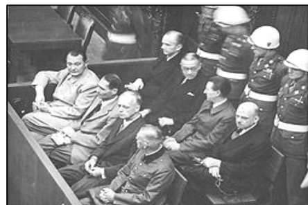
图：纽伦堡审判历史图片

【明慧网】在 60 多年前对德国纳粹罪行进行审判的纽伦堡审判，是人类有史以来最大规模的审判。审判一开始，所有纳粹战犯用同一个理由为自己辩护：“执行法律的人不受法律追究，杀害犹太人是执行法律。”希特勒通过法治实施专制和运用法律灭绝种族。对待犹太人，第一步通过立法进行身份上的区分，使犹太人和其他人区别开来；第二步通过立法禁止犹太人经商，切断了犹太人的财富来源；第三步通过强制劳役法，使有劳动能力的犹太人从事超强度的劳役，在将他们的体力耗尽后再赶往集中营从肉体上消灭。600 万犹太人就是这样分步骤被屠杀的。因此所有纳粹战犯都有理由说：杀人是在执行法律。