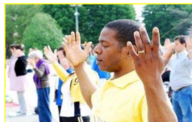
“真善忍”巨大威德和感召力超越国界，受到各族裔的珍视。图为今年五月法国法轮功学员在庆祝活动中集体炼功。

各国、各地政府和团体组织纷纷颁发褒奖、通过支持议案，及宣布“法轮大法月”、“法轮大法周”和“法轮大法日”，以各种形式支持法轮大法。