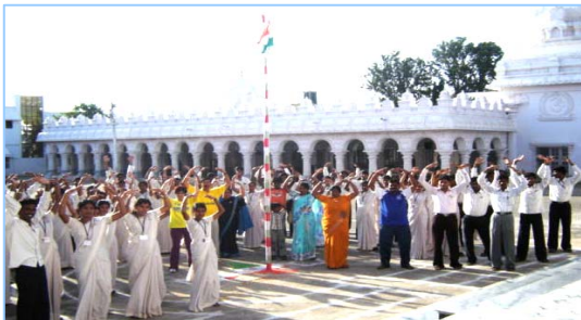
■ 在印度班加罗尔炼功 (2009.5)

在古老的佛国印度，大城市都有炼功点，仅班加罗尔就有八十多所学校师生修炼法轮功，学生在体育课集体炼功，法轮大法主要著作《转法轮》中的《论语》还被纳入学校英文教材的卷首；很多偏僻地区的学校的师生也集体修炼法轮功。