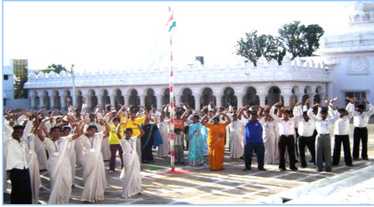
■ 在印度班加罗尔炼功 (2009.5)

在古老的佛国印度，大城市都有炼功点，仅班加罗尔就有八十多所学校师生修炼法轮功，学生在体育课集体炼功，法轮大法主要著作《转法轮》中的《论语》还被纳入学校英文教材的卷首；很多偏僻地区的学校的师生也集体修炼法轮功。