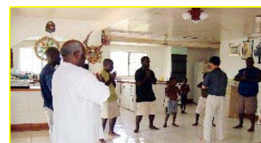
南太平洋岛国—巴布亚新几内亚前副总理及家人学炼法轮功。