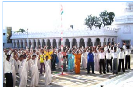
■ 在印度班加罗尔炼功 (2009.5)