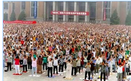
■ 沈阳万名法轮功学员集体炼功 (1998 年)。

在古老的佛国印度，大城市都有炼功点，仅班加罗尔就有八十多所学校师生修炼法轮功，学生在体育课集体炼功，法轮大法主要著作《转法轮》中的《论语》被纳入学校英文教材的卷首。