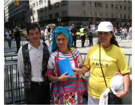
来自拉丁美洲的曼农（左）和两位来自墨西哥的法轮功学员