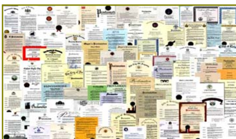
■ 法轮大法获各国政府褒奖、支持 议案信函 3000 多项。

在这些现象的背后有没有深层的原因？有心人会发现许多问题，如：手无寸铁的法轮功为什么能抵挡住中共不计后