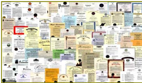
■ 法轮大法获各国政府褒奖、支持 议案信函 3000 多项。

在这些现象的背后有没有深层的原因？有心人会发现许多问题，如：手无寸铁的法轮功为什么能抵挡住中共不计后