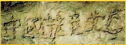
■ 二 零 零 二 年 六 月，贵州省平塘县风景区惊

真是人逢喜事精神爽。没想到老爸这一退党，竟然退掉了使他犯愁了好几年的老毛病。他退党后没过几天，人就痊愈出院了。到零九年五月，三年过去了，老爸再也没犯过这种稀奇古怪的老毛病。