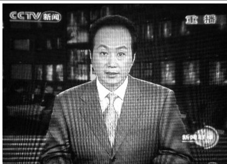
2009 年 6 月 5 日原央视主持人、新闻编辑部副科长罗京 48 岁死于淋巴瘤