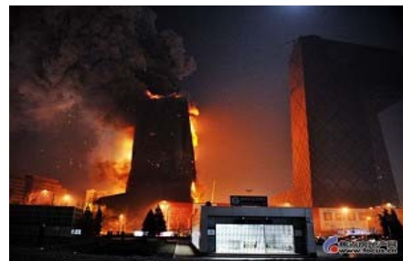
2009 年 2 月 9 日元宵夜，北京央视新大楼已经完工的附属楼发生大火。