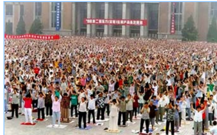
■ 沈阳万名法轮功学员集体炼功 (1998 年)。

在古老的佛国印度，大城市都有炼功点，仅班加罗尔就有八十多所学校师生修炼法轮功，学生在体育课集体炼功，法轮大法主要著作《转法轮》中的《论语》被纳入学校英文教材的卷首。