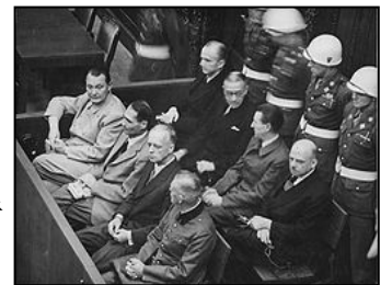
图：纽伦堡审判历史图片

【明慧网】在 60 多年前对德国纳粹罪行进行审判的纽伦堡审判，是人类有史以来最大规模的审判。审判一开始，所有纳粹战犯用同一个理由为自己辩护：“执行法律的人不受法律追究，杀害犹太人是在执行法