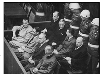
图：纽伦堡审判历史图片

【明慧网】在 60 多年前对德国纳粹罪行进行审判的纽伦堡审判，是人类有史以来最大规模的审判。审判一开始，所有纳粹战犯用同一个理由为自己辩护：“执行法律的人不受法律追究，杀害犹太人是在执行法