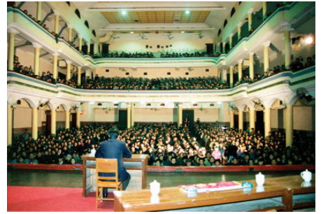
93 年 3 月，李洪志先生在武汉第二期传授班上讲法传功

1994 年 3 月 27 日，师父到大连首次传功讲法。当日在讲法班的礼堂门前，驶来一辆轿车。一位 50 多岁的女士下车后，因行走困难，由她的先生背入会场，坐在第一排前自带的躺椅上。