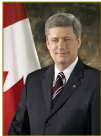
■加拿大总理哈珀致信贺法轮大法日。

❖ 法轮大法已洪传世界一百一十四个国家和地区（其中亚洲：三十二国；美洲：二十一国；欧洲：四十六国；大洋洲：三国；非洲：十二国）。