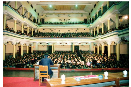
93 年 3 月，李洪志先生在武汉第二期传授班上讲法传功

1994 年 3 月 27 日，师父到大连首次传功讲法。当日在讲法班的礼堂门前，驶来一辆轿车。一位 50 多岁的女士下车后，因行走困难，由她的先生背入会场，坐在第一排前自带的躺椅上。