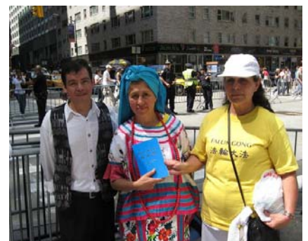
来自拉丁美洲的曼农(左)和两位来自墨西哥的法轮功学员