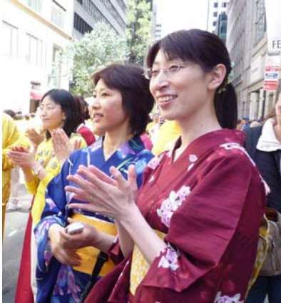
山川女士很高兴来参加 纽约法轮功大游行

弟子前来游行，这个活动深深吸引了她。看到各个民族的大法弟子，有西方人也有东方人，心里非常感动。