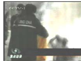
3、手摸被打后的头部