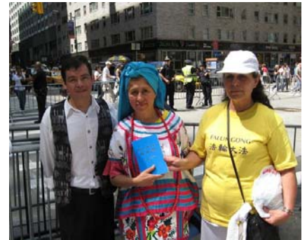
来自拉丁美洲的曼农(左)和两位来自墨西哥的法轮功学员