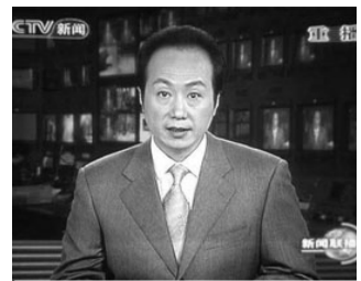
原央视主持人、新闻编辑部副科长罗京（48岁）