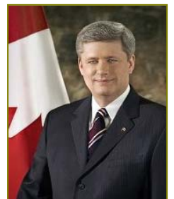
■ 加拿大总理哈珀致信贺大法日。(2009.5)