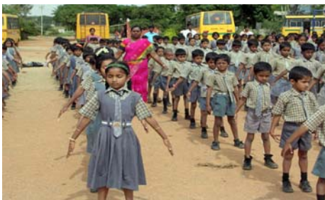
■“真善忍”的巨大威德和感召力超越国界，受到各族裔的珍视。图为印度师生在炼功。

文明古国印度人口居世界第二，包括孟买、新孟买、普尼、海得堡、班哥罗、新德里等大城市都有法轮功炼功点，仅班加罗尔就有八十多所学校师生修炼法轮功，学生在体育课集体炼功，法轮大法主要著作《转法轮》中的《论语》还被纳入学校英文教材的卷首；很多偏僻地区的学校的师生也集体修炼法轮功。◇