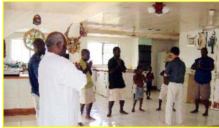
■南太平洋岛国—巴布亚新几内亚前副总理及家人学炼法轮功