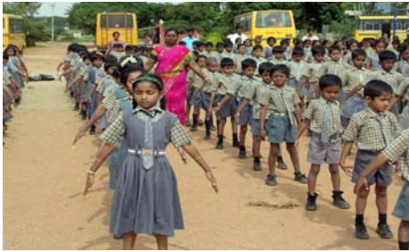
■“真善忍”的巨大威德和感召力超越国界，受到各族裔的珍视。图为印度师生在炼功。

文明古国印度人口居世界第二，包括孟买、新孟买、普尼、海得堡、班哥罗、新德里等大城市都有法轮功炼功点，仅班加罗尔就有八十多所学校师生修炼法轮功，学生在体育课集体炼功，法轮大法主要著作《转法轮》中的《论语》还被纳入学校英文教材的卷首；很多偏僻地区的学校的师生也集体修炼法轮功。◇