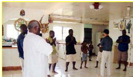
■南太平洋岛国—巴布亚新几内亚前副总理及家人学炼法轮功