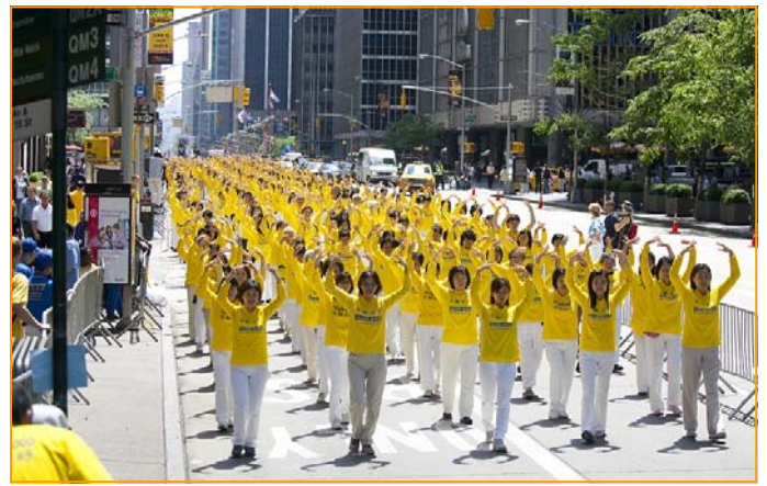
上图：几百人的炼功队伍随着炼功音乐，展示着法轮功“缓、慢、圆”的功法，众人为之惊叹。