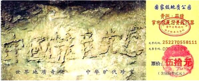
图为藏字石风景区门票：“中国共产党亡”清晰可见

2002 年被发现的、位于贵州省平塘县掌布风景区内“藏字石”，被中科院地质专家鉴定为有 2 亿 7 千万年的历史，五百年前从崖壁落下一分为二，石头断面上清晰可见的六个字是：中国共产党亡(见下图风景区门票)。而央视和国内媒体报道时都隐去了最后一个字。