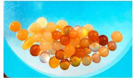
释迦牟尼佛七彩圆舍利 Shakyamuni Buddha Seven Colour Head Shrine

有关释迦牟尼的一些事情, 历史流传下来的很多佛经中都有记载。释迦牟尼是古印度迦毗罗卫国(今尼泊尔境内)的太子。19 岁时, 他有感于人世生、老、病、死等诸多苦恼, 舍弃王族生活, 出家修行。35 岁在菩提树下悟道, 弘法 49 年, 80 岁左右涅槃。弟子们在火化他的遗体时从灰烬中得到了 84000 颗珠状真身舍利子(图)。这些舍利子晶亮透明、五光十色、坚硬如钢。公元前三世纪阿育王统一印度后, 将佛的舍利分送世界各国建塔供奉, 中国有十九处。