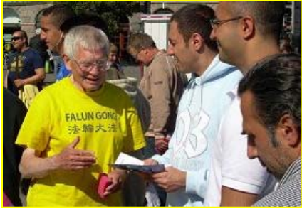
■ 八旬丹麦退休飞机工程师鲍尔，炼法轮功十一年，身心受益，白发里长出了黑发。零九年五月“大法日”之际，他向当地人介绍法轮功。

在古老的佛国印度，大城市都有炼功点，仅班加罗尔就有八十多所学校师生修炼法轮功，学生在体育课集体炼功，法轮大法主要著作《转法轮》中的《论语》被纳入学校英文教材的卷首。