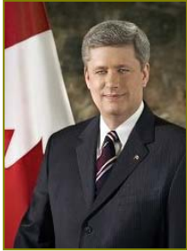
■ 加拿大总理哈珀致信贺大法日。(2009.5)