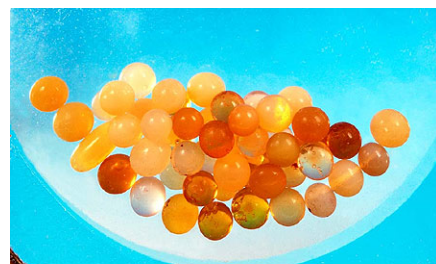
释迦牟尼佛七彩圆舍利 Shakyamuni Buddha Seven Colour Head Shrine

有关释迦牟尼的一些事情, 历史流传下来的很多佛经中都有记载。释迦牟尼是古印度迦毗罗卫国(今尼泊尔境内)的太子。19 岁时, 他有感于人世生、老、病、死等诸多苦恼, 舍弃王族生活, 出家修行。35 岁在菩提树下悟道, 弘法 49 年, 80 岁左右涅槃。弟子们在火化他的遗体时从灰烬中得到了 84000 颗珠状真身舍利子(图)。这些舍利子晶亮透明、五光十色、坚硬如钢。公元前三世纪阿育王统一印度后, 将佛的舍利分送世界各国建塔供奉, 中国有十九处。