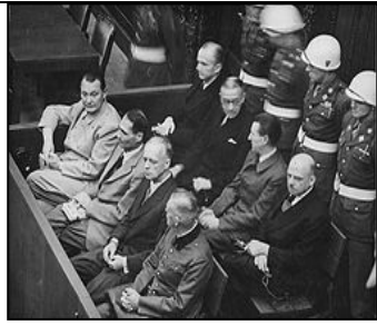
图：纽伦堡审判历史图片

律。”希特勒通过法治实施专制和运用法律灭绝种族。对待犹太人，第一步通过立法进行身份上的区分，使犹太人与其他人区别开来；第二步通过立法禁止犹太人经商，切断了犹太人的财富来源；第三步通过强制劳役法，使有劳动能力的犹太人从事超强度的劳役，在将他们的体力耗尽后再赶往集中营从肉体上消灭。600万犹太人就是这样分步骤被屠杀的。因此所有纳粹战犯都有理由说：杀人是在执行法律。