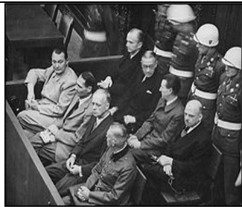
图：纽伦堡审判历史图片

律。”希特勒通过法治实施专制和运用法律灭绝种族。对待犹太人，第一步通过立法进行身份上的区分，使犹太人与其他人区别开来；第二步通过立法禁止犹太人经商，切断了犹太人的财富来源；第三步通过强制劳役法，使有劳动能力的犹太人从事超强度的劳役，在将他们的体力耗尽后再赶往集中营从肉体上消灭。600万犹太人就是这样分步骤被屠杀的。因此所有纳粹战犯都有理由说：杀人是在执行法律。