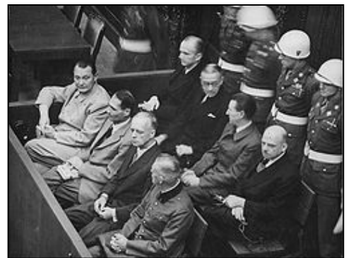
图：纽伦堡审判历史图片

【明慧网】在 60 多年前对德国纳粹罪行进行审判的纽伦堡审判，是人类有史以来最大规模的审判。审判一开始，所有纳粹战犯用同一个理由为自己辩护：“执行法律的人不受法律追究，杀害犹太人是执行法律。”希特勒通过法治实施专制和运用法律灭绝种族。对待犹太人，第一步通过立法进行身份上的区分，使犹太人与其他人区别开来；第二步通过立法禁止犹太人经商，切断