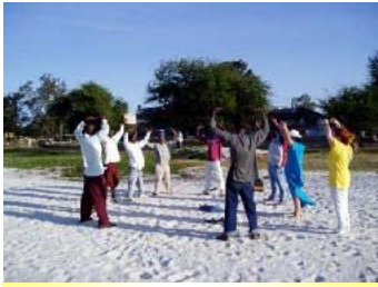
法轮功学员在坦桑尼亚首都达累斯萨拉姆教功

道德提升。迄今，法轮功弘传于一百一十四个国家与地区，使上亿人身心受益；法轮功书籍已经被翻译成三十八种语言在世界各地发行；法轮功在海外获得了超过三千项褒奖、支持议案信函。