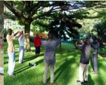
乌干达新建的炼功点

从毗邻北极的格陵兰岛到接近南极的新西兰南岛，从气候寒冷的北欧到赤日炎炎的南亚，远至