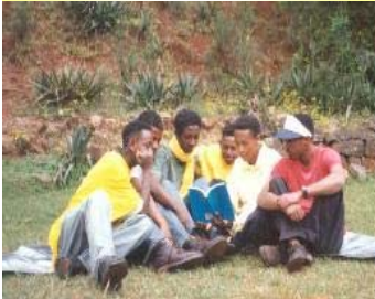
埃塞俄比亚法轮功学员集体学法