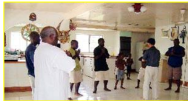
■南太平洋岛国—巴布亚新几内亚前副总理及家人学炼法轮功。