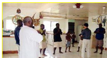
■南太平洋岛国—巴布亚新几内亚前副总理及家人学炼法轮功。