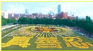
■一九九八年，武汉，五千多名法轮功学员集体炼功。