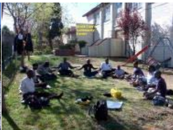
法轮功学员在南非约翰内斯堡炼功