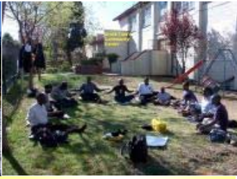
法轮功学员在南非约翰内斯堡炼功