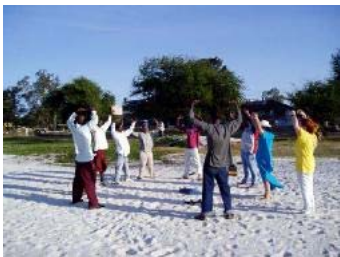
法轮功学员在坦桑尼亚首都达累斯萨拉姆教功

道德提升。迄今，法轮功弘传于一百一十四个国家与地区，使上亿人身心受益；法轮功书籍已经被翻译成三十八种语言在世界各地发行；法轮功在海外获得了超过三千项褒奖、支持议案信函。