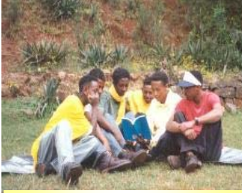
埃塞俄比亚法轮功学员集体学法