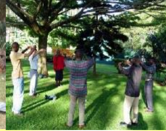
乌干达新建的炼功点

从毗邻北极的格陵兰岛到接近南极的新西兰南岛，从气候寒冷的北欧到赤日炎炎的南亚，远至