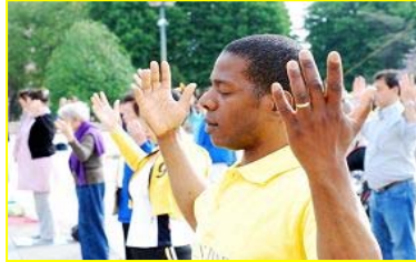
■“真善忍”巨大威德和感召力超越国界，受到各族裔的珍视。图为今年五月法国法轮功学员在庆祝活动中集体炼功。