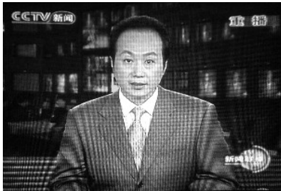
2009年6月5日原央视主持人、新闻编辑部副科长罗京48岁死于淋巴瘤。

2009年6月5日，中共喉舌央视主播罗京癌症不治死亡，据报道，罗京在患病期间，口腔严重溃疡，舌头溃烂，疼痛难忍，不能说话。