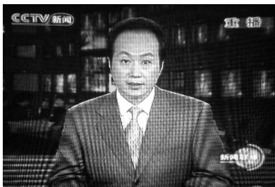
2009年6月5日原央视主持人、新闻编辑部副科长罗京48岁死于淋巴瘤。

2009年6月5日，中共喉舌央视主播罗京癌症不治死亡，据报道，罗京在患病期间，口腔严重溃疡，舌头溃烂，疼痛难忍，不能说话。