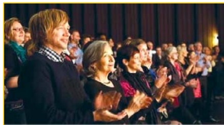
▲ 意犹未尽的挪威观众。▶ 3月25日,台湾的39场神韵演出圆满落幕。民进党主席蔡英文致花篮祝贺。

出了我的想像。神韵艺术团第一是有人才，第二，制作节目是精益求精。”“节目所表达的善、所承载的道德内涵，确实很感人。我看节目好多年都没有掉过泪了，今天看到一家人受到迫害的节目，我还是掉泪了，真的挺感动的。”