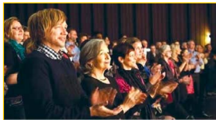
▲ 意犹未尽的挪威观众。▶ 3月25日,台湾的39场神韵演出圆满落幕。民进党主席蔡英文致花篮祝贺。

出了我的想像。神韵艺术团第一是有人才，第二，制作节目是精益求精。”“节目所表达的善、所承载的道德内涵，确实很感人。我看节目好多年都没有掉过泪了，今天看到一家人受到迫害的节目，我还是掉泪了，真的挺感动的。”