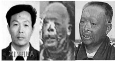
三个不同的：“王进东”

2001年8月14日在联合国会议上声明指出：“中共当局企图以自焚事件为证据诬陷法轮功，而我们得到的录像分析表明，整个事件是中共当局一手编造、导演的。”