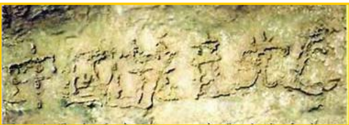
■ 二零零二年六月，贵州省平塘县风景区惊

真是人逢喜事精神爽。没想到老爸这一退党，竟然退掉了使他犯愁了好几年的老毛病。他退党后没过几天，人就痊愈出院了。到零九年五月，三年过去了，老爸再也没犯过这种稀奇古怪的老毛病。