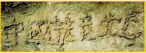
二零二六年六月，贵州省

真是人逢喜事精神爽。没想到老爸这一退党，竟然退掉了使他犯愁了好几年的老毛病。他退党后没过几天，人就痊愈出院了。到零九年五月，三年过去了，老爸再也没犯过这种稀奇古怪的老毛病。