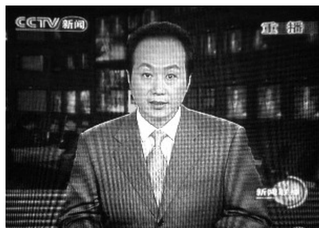
2009年6月5日原中共央视主持人、新闻编辑部副科长罗京48岁死于淋巴瘤