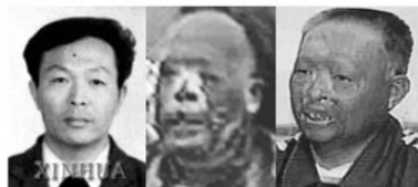
三个不同的：“王进东”