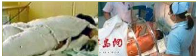
（左图：用绷带包裹严密的“自焚者”。右图：烧伤病人在病房中要裸露伤口。）