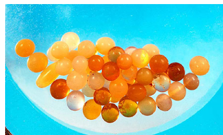
释迦牟尼佛七色彩圆舍利 Shakyamuni Buddha Seven Colour Head Shrine

有关释迦牟尼的一些事情，历史流传下来的很多佛经中都有记载。释迦牟尼是古印度迦毗罗卫国（今尼泊尔境内）的太子。19岁时，他有感于人世生、老、病、死等诸多苦恼，舍弃王族生活，出家修行。35岁在菩提树下悟道，弘法49年，80岁左右涅槃。弟子们在火化他的遗体时从灰烬中得到了84000颗珠状真身舍利子（图）。这些舍利子晶亮透明、五光十色、坚硬如钢。公元前三世纪阿育王统一印度后，将佛的舍利分送世界各国建塔供奉，中国有十九处。