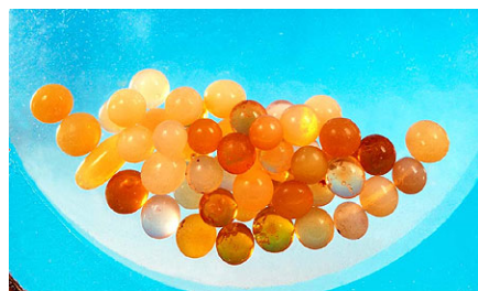
释迦牟尼佛七彩圆舍利 Shakyamuni Buddha Seven Colour Head Shrine

有关释迦牟尼的一些事情, 历史流传下来的很多佛经中都有记载。释迦牟尼是古印度迦毗罗卫国(今尼泊尔境内)的太子。19 岁时, 他有感于人世生、老、病、死等诸多苦恼, 舍弃王族生活, 出家修行。35 岁在菩提树