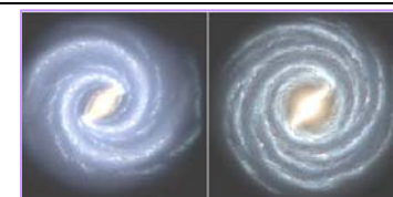
左图：银河系的目前结构 右图：较早的银河系图像 2008 年，天文学家接连发布惊人发现：银河系丢失两个主螺旋臂、太阳正在被银河系抛离诞生地、人类生存的地球似正陷于真空反常时空泡沫中。

中共自建政后，战天斗地、谤佛焚经、压制正信，在 49 年后的和平时期，由于其残酷的政治运动和荒诞的大炼钢铁、大放卫星，导致七千多万中国人非正常死亡，相当于六十年来每三个月进行一次南京大屠杀。中共无论在软环境（思想道德领域），还是在硬环境（自然环境、物资资源）都给中华民族带来了巨大的灾难。进入现代社会，中共又毫无