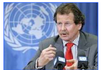
联合国人权委员会酷刑问题专员诺瓦克先生

1999 年 7 月 20 日中共迫害法轮功至今，至少有 6000 人被非法判刑，超过 10 万人被非法劳教，数千人被强迫送入精神病院。据“追查迫害法轮功国际组织”2003 年 3 月发布的资料：目前中国经济资源的四分之一被用于迫害法轮功。