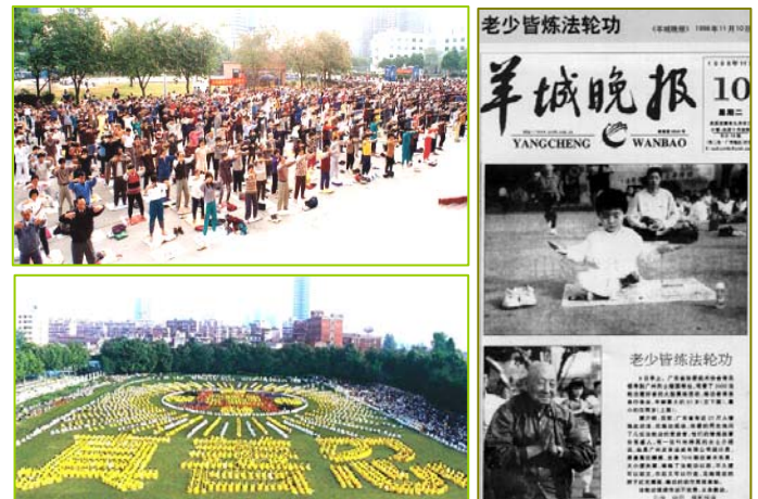
上图：1998 年北京法轮功学员晨炼。下图：1997 年武汉 5000 多法轮功学员炼功组字。法轮功 1992 年从中国传出，因对人类身心的巨大益处，倍受喜爱。右图：老少皆炼法轮功（《羊城晚报》1998.11.10）