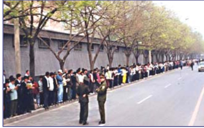
法轮功学员文明安静，警察不用维持秩序，在一旁聊天。

4·25当晚，江泽民出于妒忌，强行推翻政府总理的开明决定，把和平上访歪曲成“围攻中南海”，