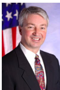
纽约州众议员 菲尔·博伊尔

【明慧网】二零零九年六月十八日，在美国纽约州首府奥本尼议会内，由州众议员菲尔·博伊尔（Assemblyman Phil Boyle）先生发起的，呼吁奥巴马总统要求中共立即停止迫害法轮功的联合签名信，在二十四小时的征签中已有五十多名议员亲自签名。在“七·二零”中共残酷迫害法轮功整整十年之际，联名信呼吁奥巴马总统为了促进人权，谴责中共的镇压政策，并要求中共结束这场旷日持久的恐怖迫害，让法轮大法修炼者恢复和平与安宁的修炼和生活。