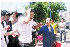
升旗杆铁钩钩住老师头部

事情发生在 6 月 22 日，吉林省第二实验学校按照规定，该校体育老师组织学生举行升旗仪式。升旗过程中，移动杆突然坠落，一根长约 1.5 米的移动杆的铁钩钩住了他的头部，钩入部分约有 5 厘米。由于杆长，救援官兵先用断电剪将铁钩以下的移动杆固定住，然后用液压剪将其余部分剪掉，后送往医院。