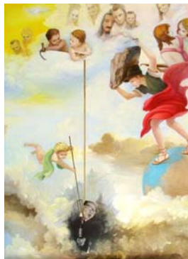
明慧网上的“坚忍不屈的精神”绘画作品选登——天使的审判。