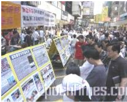
▲香港法轮功学员的真相点

“我看到有人刚开始看展板时还在笑，可是他们越来越认真，有的人还拿着相机将展板照下来。我能够感受到他们了解到真相后的变化。希望中国人能够不再受中共谎言的欺骗，能了解更多的真相。”◇