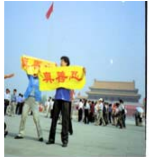
资料图片：大法弟子面临迫害不动摇，在天安门广场打出真善忍横幅

以前我是厂长兼党支部书记，在一次查夜岗时从高处摔下来，造成重伤。从那时起我这个一米八的大