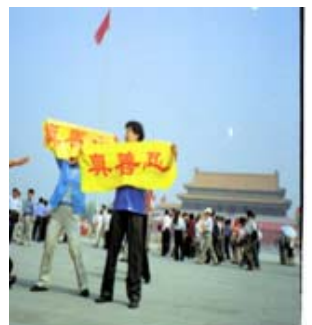
资料图片：大法弟子面临迫害不动摇，在天安门广场打出真善忍横幅

以前我是厂长兼党支部书记，在一次查夜岗时从高处摔下来，造成重伤。从那时起我这个一米八的大