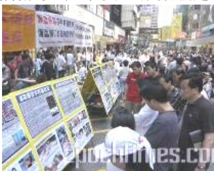
▲香港法轮功学员的真相点

“我看到有人刚开始看展板时还在笑，可是他们越来越认真，有的人还拿着相机将展板照下来。我能够感受到他们了解到真相后的变化。希望中国人能够不再受中共谎言的欺骗，能了解更多的真相。”◇