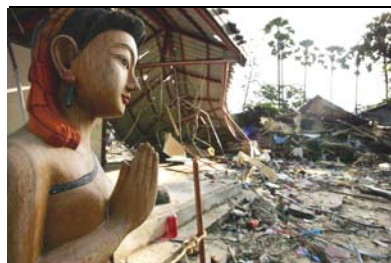
左图：泰国普吉岛，一尊完整的木雕佛像站立在一间被毁坏的潜水商店前。

然而，几十年来，中共一直用“无神论”给中国人洗脑，妄图彻底毁灭中华民族信神敬天的传统文化。中共大肆推行的“假、恶、斗”的党