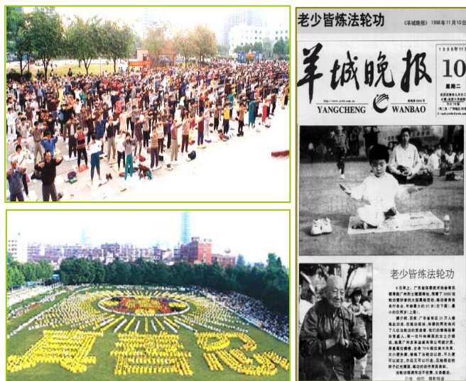
上图：1998 年北京法轮功学员晨炼。下图：1997 年武汉 5000 多法轮功学员炼功组字。法轮功 1992 年从中国传出，因对人类身心的巨大益处，倍受喜爱。右图：老少皆炼法轮功（《羊城晚报》1998.11.10）