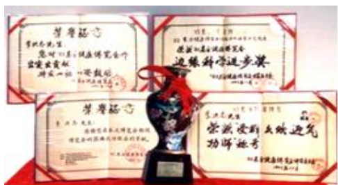
李洪志老师参加 1993年东方健康博 览会获得奖杯和奖状

师父询问了孩子的情况。因为孩子没来，让他们父子想一下孩子的形象，师父用手比了一个小孩形，然后动手象抽丝一样清理救治小孩。过了一会儿师父说好了，你可以打电话问一下孩子的情况。因为师父住的不是高级宾馆，当年这个宾馆没开通国际长途，两位法国客人回到自己下榻的宾馆，马上给家里打电话：他妻子接电话就说你怎么才来电话，刚才家里发生奇迹了，家里进了一片金光，孩子突然会动、会说话了，问：“妈妈怎么了？”孩子好了，真是奇迹！在此之前，孩子躺在床上不会动、不会说话。◇