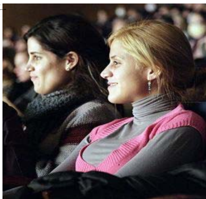
二零零九年六月二十八日，阿根廷首都布宜诺斯艾利斯市第二场神韵晚会的观众

二零零九年六月二十八日和二十九日，神韵巡回艺术团在阿根廷首都布宜诺斯艾利斯市 Auditorio Belgrano 剧院上演了第二场和第三场演出，神韵巡回艺术团精湛的表演，赢来阵阵掌声和喝彩声。现场的中、西方观众热情洋溢，毫不掩饰对演出的喜爱之情，演出中，叫好声不绝于耳。