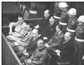
图：纽伦堡审判历史图片

害犹太人是在执行法律。”希特勒通过法治实施专制和运用法律灭绝种族。对待犹太人，第一步通过立法进行身份上的区分，使犹太人与其他人区别开来；第二步通过立法禁止犹太人经商，切断了犹太人的财富来源；第三步通过强制劳役法，使有劳动能力的犹太人从事超强度的劳役，在将他们的体力耗尽后再赶往集中营从肉体上消灭。600万犹太人就是这样分步骤被屠杀的。因此所有纳粹战犯都有理由说：杀人是在执行法律。