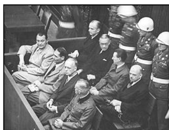
图：纽伦堡审判历史图片

害犹太人是在执行法律。”希特勒通过法治实施专制和运用法律灭绝种族。对待犹太人，第一步通过立法进行身份上的区分，使犹太人与其他人区别开来；第二步通过立法禁止犹太人经商，切断了犹太人的财富来源；第三步通过强制劳役法，使有劳动能力的犹太人从事超强度的劳役，在将他们的体力耗尽后再赶往集中营从肉体上消灭。600万犹太人就是这样分步骤被屠杀的。因此所有纳粹战犯都有理由说：杀人是在执行法律。