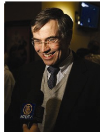
美众议员罗斯·霍特采访时盛赞神韵