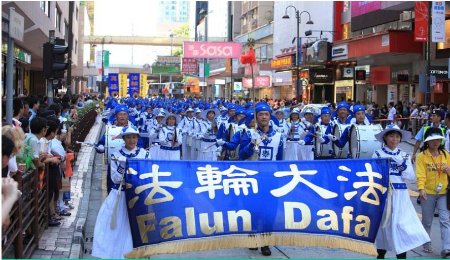
法轮功反迫害的大游行，天国乐团开道，观众云集。