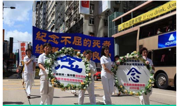
悼念被迫害致死的法轮功学员

集会场地打出了写着“解体中共才能停止迫害”的大横幅，多位社会知名人士在集会上相继发言，他们表示，非常敬佩法轮功学员十年来坚持不懈地和平理性反迫害的精神，并且支持解体中共，制止迫害。