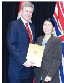
加总理哈珀发贺信 庆祝神韵巡演成功