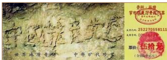
贵州省平塘县掌布风景区内的“藏字石”，被中科院地质专家鉴定为五百年前从崖壁落下一分为二，石头断面上天然形成六个字：中国共产党亡。图为风景区门票。