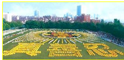
■一九九八年，武汉，五千多名法轮功学员集体炼功。

◎ 法轮大法以宇宙特性“真善忍”指导人修心向善，从根本上祛除病疾、净化身心，给人指出一条返本归真的路。在短短的七年里，因其神奇功效，迅速传遍神州大地，修者上亿。