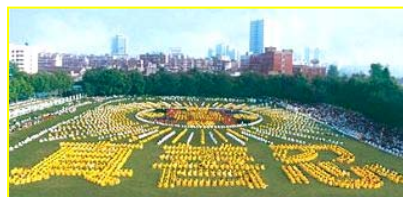
■一九九八年，武汉，五千多名法轮功学员集体炼功。

◎ 法轮大法以宇宙特性“真善忍”指导人修心向善，从根本上祛除病疾、净化身心，给人指出一条返本归真的路。在短短的七年里，因其神奇功效，迅速传遍神州大地，修者上亿。