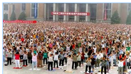
■ 沈阳万名法轮功学员集体炼功 (1998 年)。

◎ 各国、各地政府和团体组织纷纷颁发褒奖、通过支持议案，及宣布“法轮大法月”、“法轮大法周”和“法轮大法日”，以各种形式支持法轮大法。