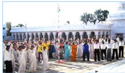
■ 在印度班加罗尔炼功 (2009.5)