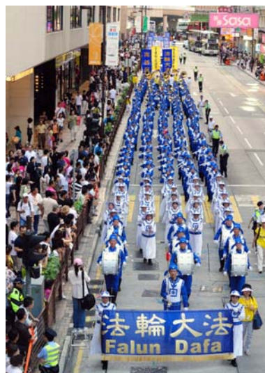
法轮功学员参加反迫害游行