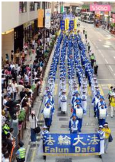
香港法轮功学员反迫害游行