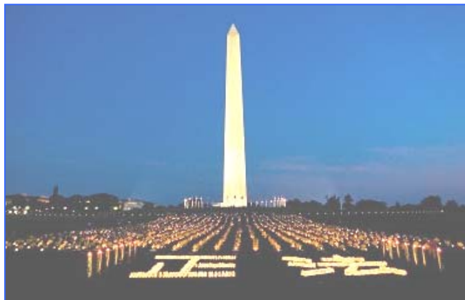
■ 2000 多名来自世界各地的法轮功学员在美国华盛顿举行反迫害活动。（2008 年 7 月）

然而，法轮功修炼团体三个月后仍然没有屈服，三年后没有倒下、十年后也没有倒下。“真、善、忍”的信仰力量，如莲花般高洁，却又如梅花般坚毅，在十年的漫漫严寒中傲雪挺立。