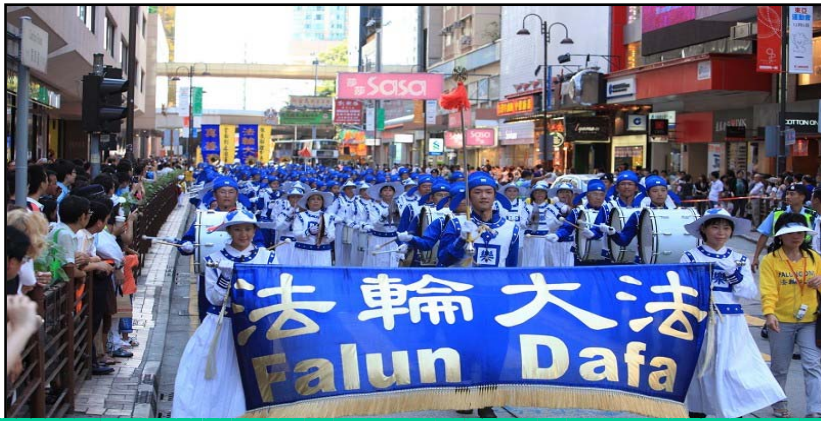
法轮功反迫害的大游行，天国乐团开道，观众云集。

在临近七月二十日法轮功反迫害满十年之际，香港法轮功学员及关注团体昨日举行“解体中共 制止迫害”集会游行，呼吁停止迫害。集会在长沙湾游乐场举行，集会场地打出了写着“解体中共才能停止迫害”的大横幅，多位社会知名人士在集会上相继发言，他们表示，非常敬佩法轮功学员十年来坚持不懈地和平理性反迫害的精神，并且支持解体中共，制止迫害。