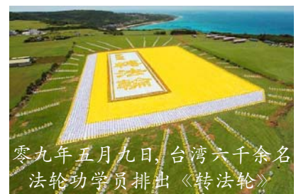
零九年五月九日，台湾六千余名法轮功学员排出《转法轮》

暴力摧毁不了真正的信仰，它只能使信仰变得更加坚强。由于中共的封锁，很多人都以为法轮功已经消声灭迹了。看看吧，我就是法轮功的新生力量！◇