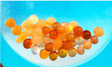
释迦牟尼佛七彩舍利

坚硬如钢。公元前三世纪阿育王统一印度后，将佛的舍利分送世界各国建塔供奉，中国有十九处。